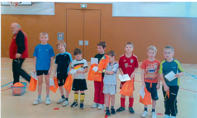
Fußball-Turnier – Sieger Jungs

Mit besonderer Spannung erwarteten wir das Fußballturnier in unserer schönen neuen Turnhalle. Wochenlang hatten wir dafür in unserem Hort-Garten, auch bei Schnee, trainiert. Zum Turnier hatten wir uns die Kinder aus dem Hort Scharfenstein eingeladen. Diese staunten über unsere moderne Halle und die Super-Bedingungen für das Turnier. Alle Spiele verliefen sehr fair. Dank unseres Heimvorteils gewannen unsere Mädchen- und Jungen Mannschaften das Turnier.